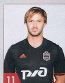
Дмитрий СЫЧЕВ 26.10.1983 Рост: 176, вес: 74