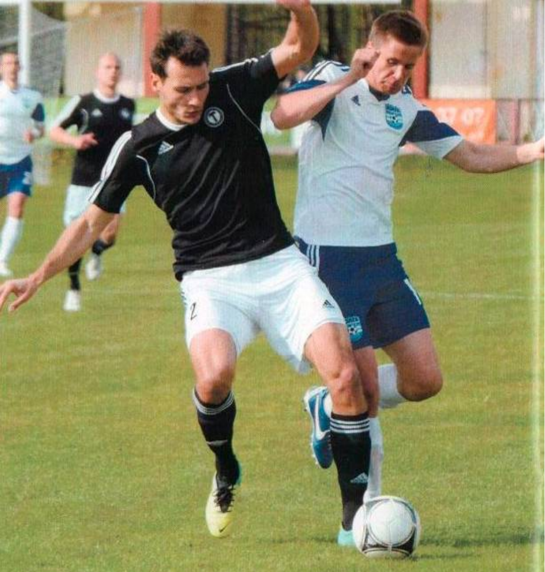
1 мая 2014 года. Тверь, стадион «Химик». «Торпедо» выиграло у «Волги» с традиционным для этих команд счетом 2:0.