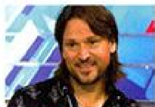
Вадим Валентинович ЕВСЕЕВ