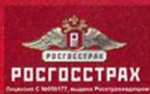
Филиал «Росгосстрах» по Костромской области