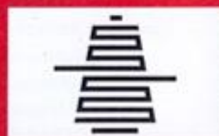
ООО СП «Кохлома»