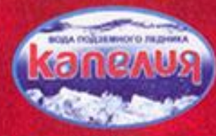
ООО «Костромской родник»