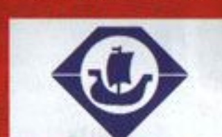
ОАО «Костромской ювелирный завод»