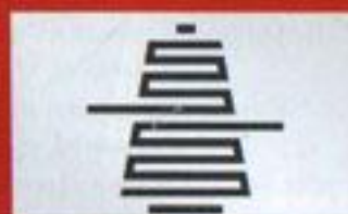
ООО СП «Кохлома»