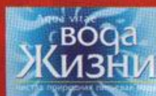
ООО «Живая вода»