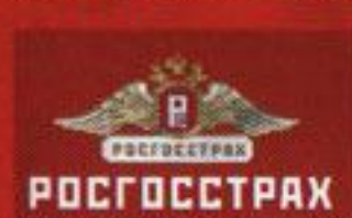
Филиал «Росгосстрах» по Костромской области