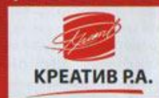
«Креатив» рекламное агентство