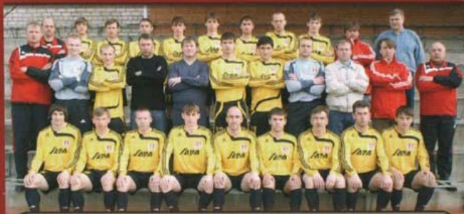
Задача на нынешний сезон - улучшить результат 2006 года

Заключительный этап подготовки проходил в Сочи, где была обыграна местная «Жемчужина» – 3:0. «Волочанину – Ратмиру» из Вышнего Волочка наши сегодняшние гости уступили – 0:1, а ульяновской «Волге» – 0:2.