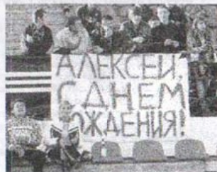
На прошлогоднем матче 10 октября 2005.

- Случайностью это быть не может. Во-первых, у нас давно сложившаяся команда, мы не первый год играем вместе. Это одна из самых главных причин. Плюс самоотдача ребят. Мы очень хотим быть на первом месте! Пока это получается... Дай Бог, чтобы и дальше было.