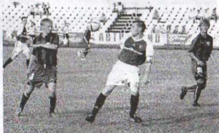
В игре против "Петрогрета" (фото справа)