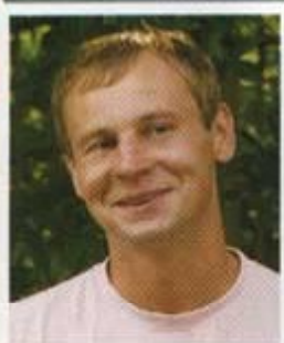
● НАШ ПОСТЕР