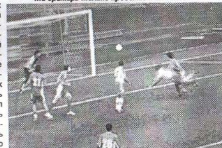
И еще один удар в падении. «Академики» в шоке.

под стать — удар на опережение защитника в падении головой в свободный угол ворот. Остается только гадать: то ли в новокузнецком «Металлурге», который ведет напряженную борьбу с иркутской «Звездой» за первое место в зоне «Восток», форварды еще лучше (тогда почему они еще не в сборной, не умеющей забивать даже на своем поле), либо там на наше счастье просчитались.