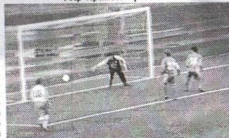
...и вратарь только пропускает мяч глазами