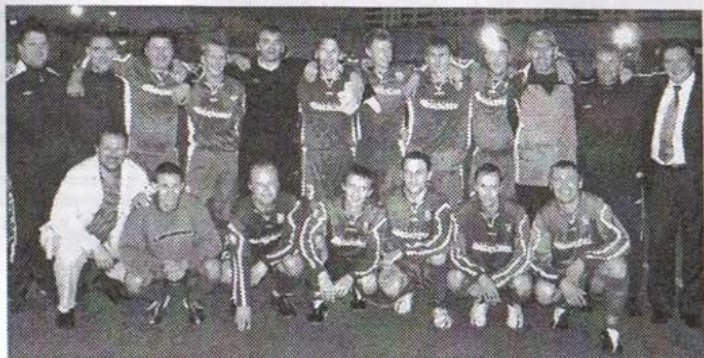
ФК «Молочное» – чемпион области 2006 г. – после победного матча против «Северстали»

– Ну, какое там забавное во время соревнований! Забавное происходит, когда мы после завершения футбольного календаря по сплывшейся традиции